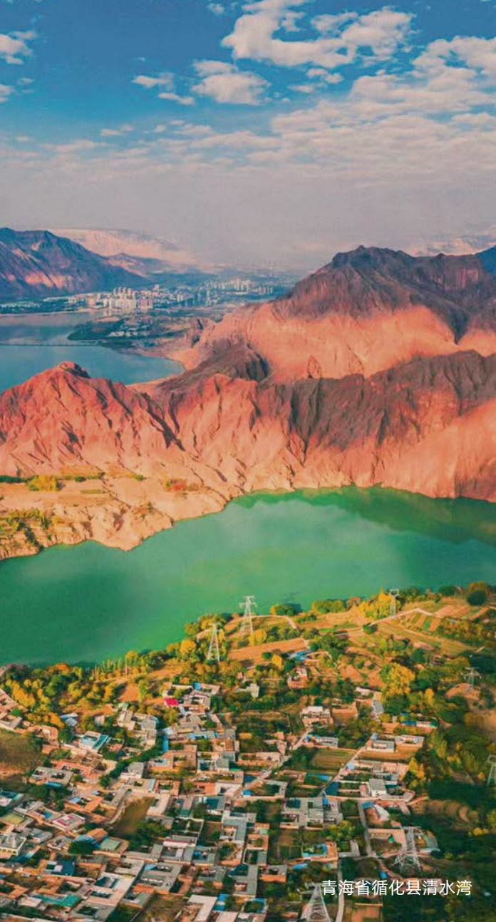
青海省循化县清水湾